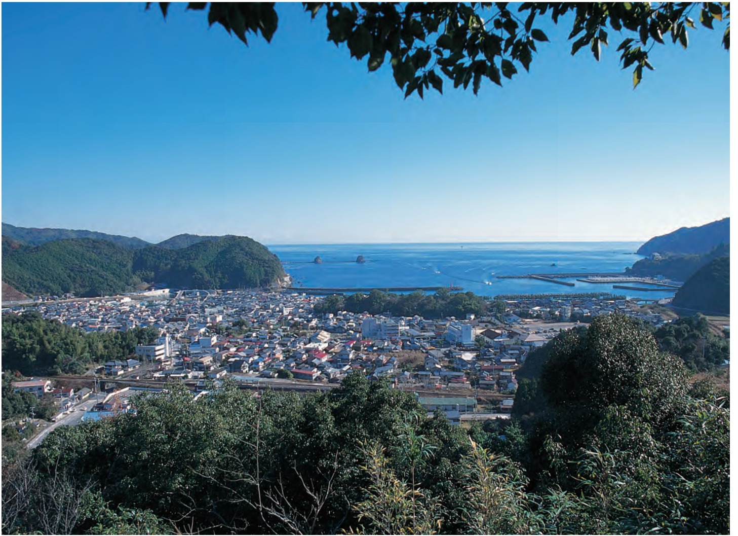
久礼の町（城山より）中央の森が久礼八幡宮、海面上のふたつの島が双名島、中央右端の山上建物が黒潮本陣（宿泊施設）