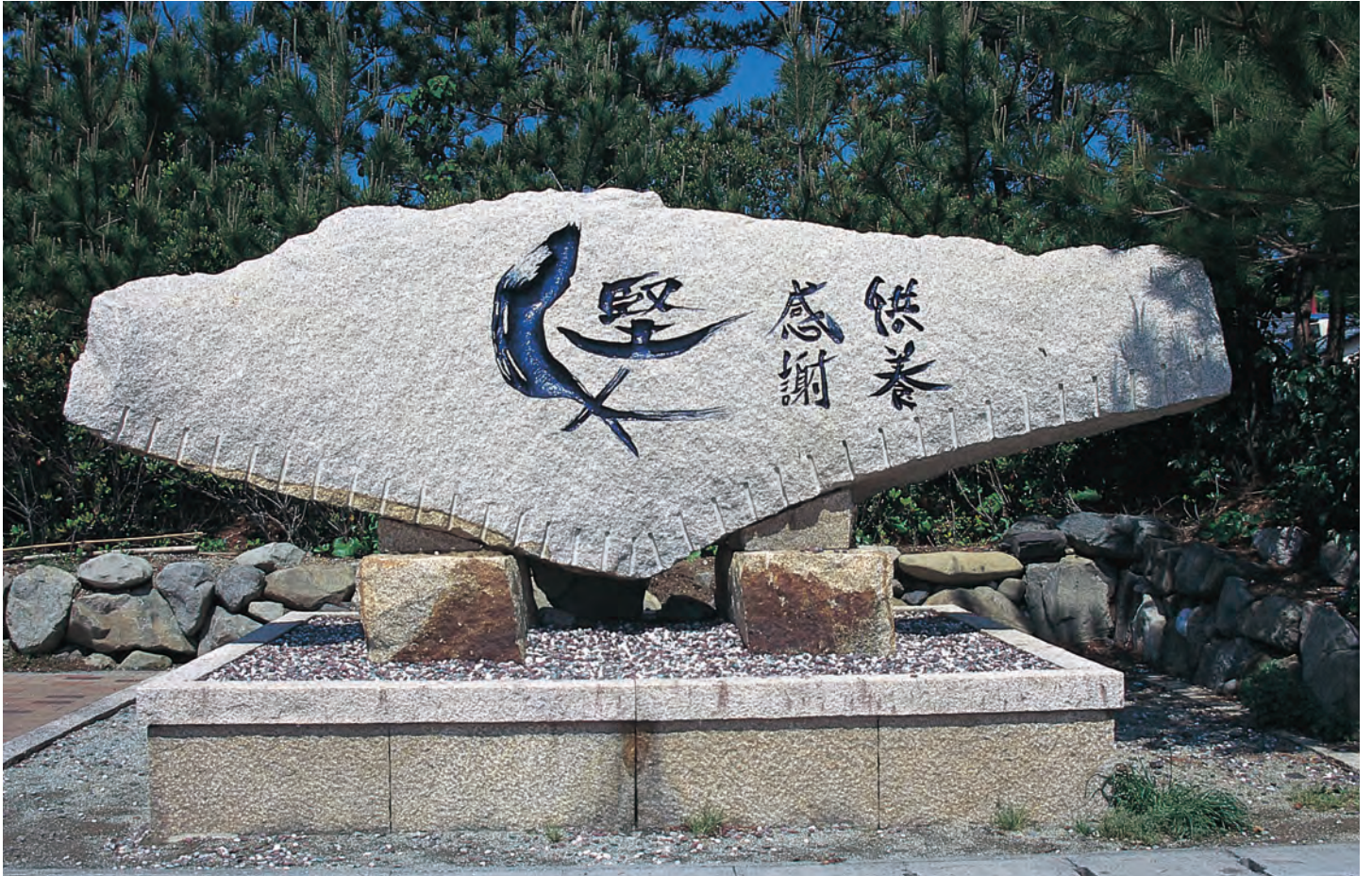
カツオの感謝供養碑 (久礼八幡宮前海浜)